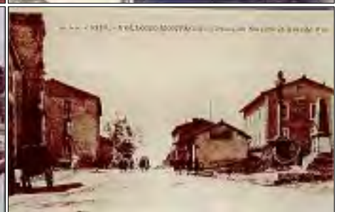
Le bourg, qui ne comptait que 16 habitants au départ, s'est progressivement étendu.

sur le chemin qui traverse la cour actuelle de l'ancien presbytère, passe devant la chapelle et sur le chemin intermédiaire en contrebas.